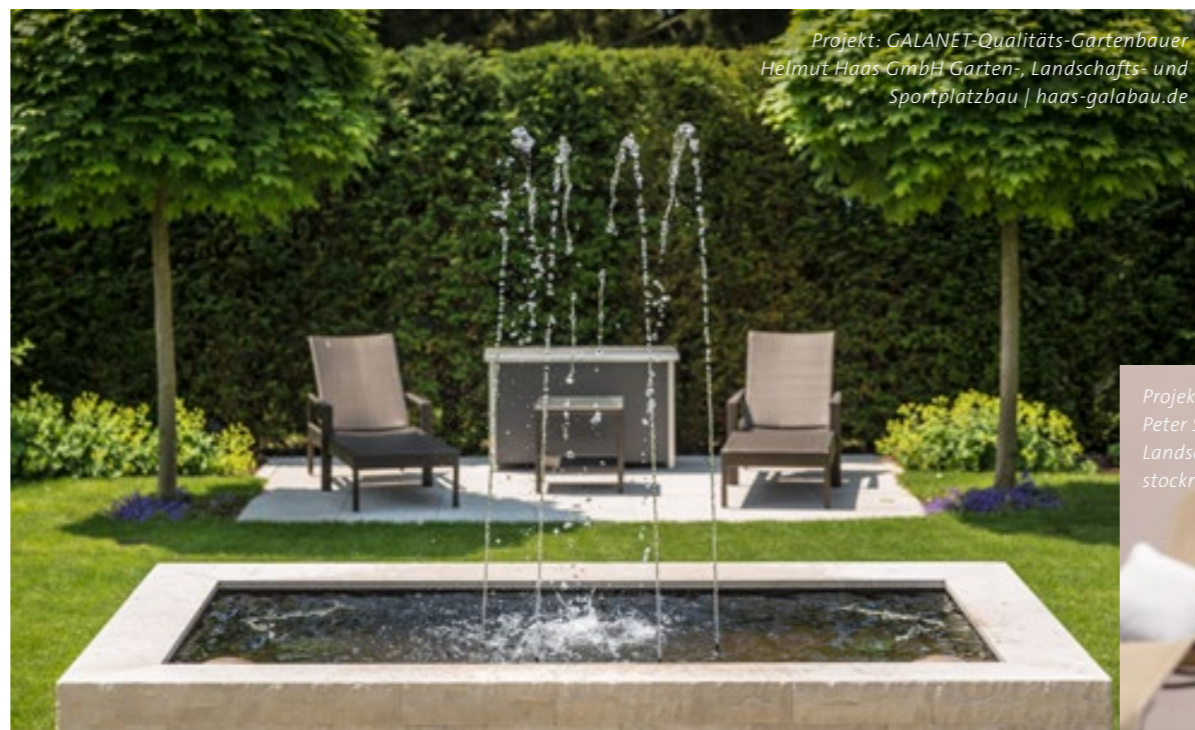
Projekt: GALANET-Qualitäts-Gartenbauer Helmut Haas GmbH Garten-, Landschafts- und Sportplatzbau | haas-galabau.de

Fließend, ruhig, sanft plätschernd, rauschend, mit Blubber, als Fontäne – die Faszination Wasser kann in Ihrem Garten viele verschiedene Formen annehmen. Ob von Anfang an mitgeplant oder als nachträgliches Element eingebaut, es macht immer eine gute Figur. Was ist Ihr Favorit?