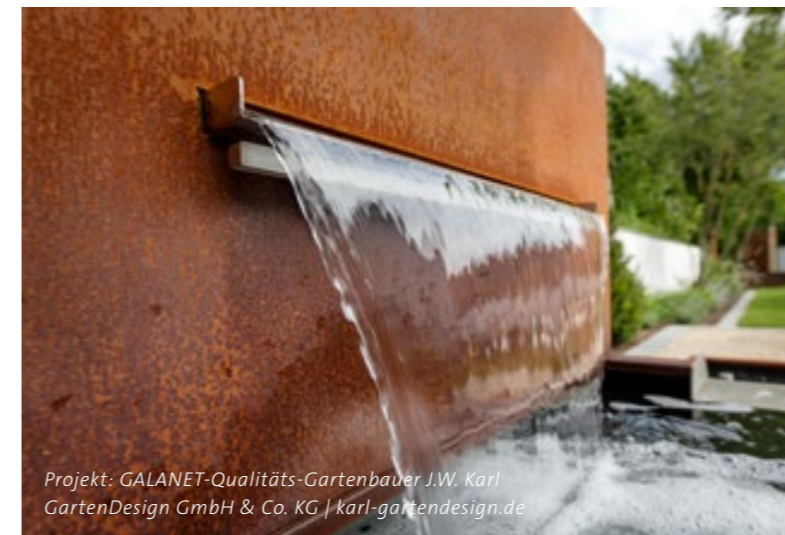
Projekt: GALANET-Qualitäts-Gartenbauer J.W. Karl GartenDesign GmbH & Co. KG | karl-gartendesign.de