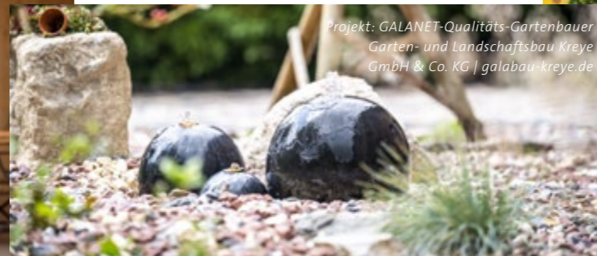
Projekt: GALANET-Qualitäts-Gartenbauer Garten- und Landschaftsbau Kreye GmbH & Co. KG | galabau-kreye.de