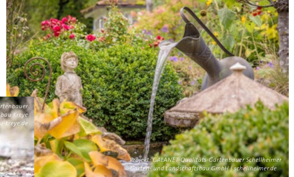
Projekt: GALANET-Qualitäts-Gartenbauer Schellheimer Garten- und Landschaftsbau GmbH | schellheimer.de