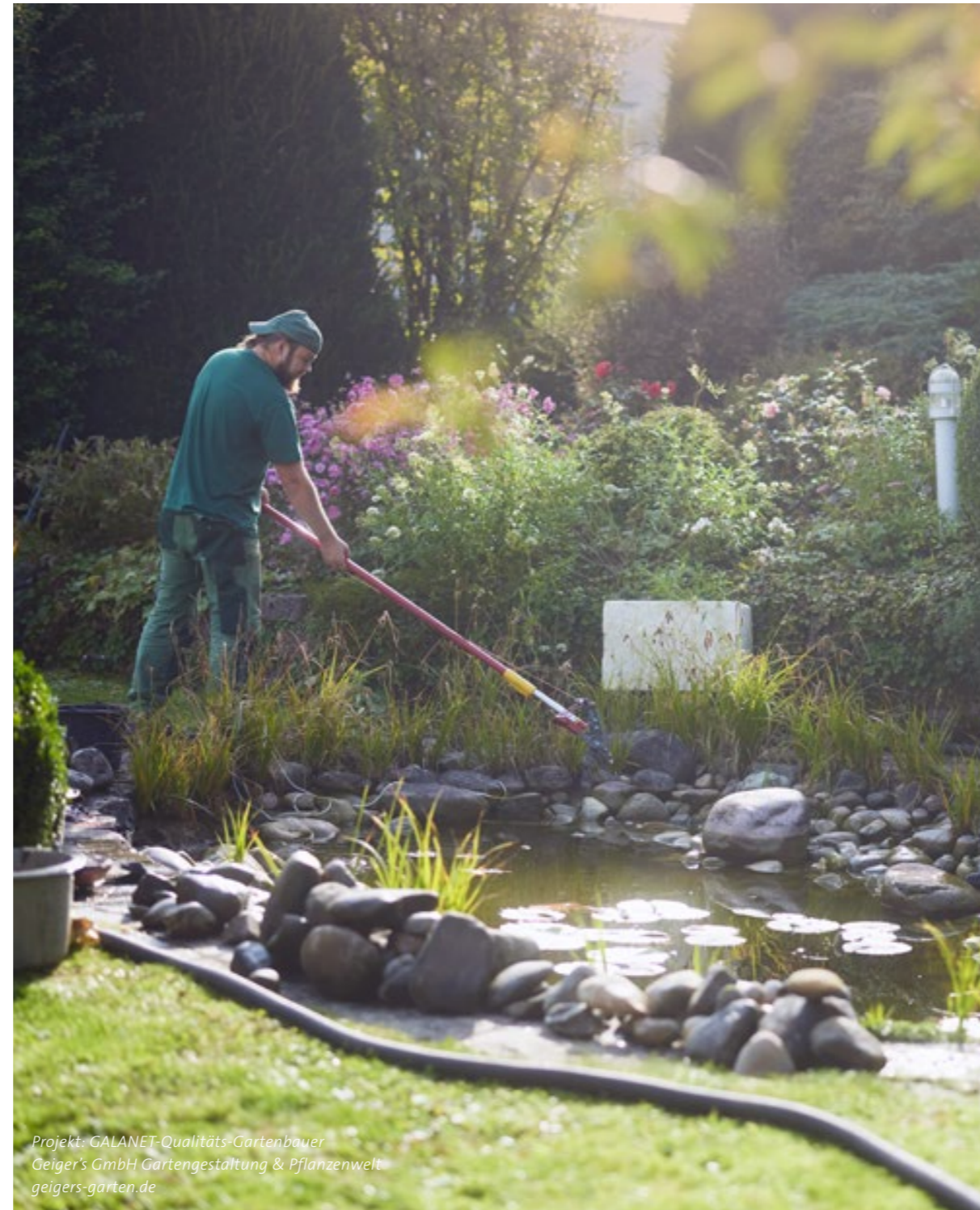
Projekt: GALANET-Qualitäts-Gartenbauer Geiger's GmbH Gartengestaltung & Pflanzenwelt geigers-garten.de